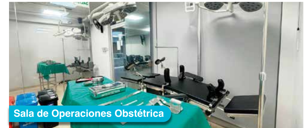
Sala de Operaciones Obstétrica

Utiliza nuestros laboratorios obstétricos especializados del más alto nivel. Desarrolla competencias técnicas, familiarizándote con equipamiento de simulación compleja. Prepárate para afrontar desafíos reales.