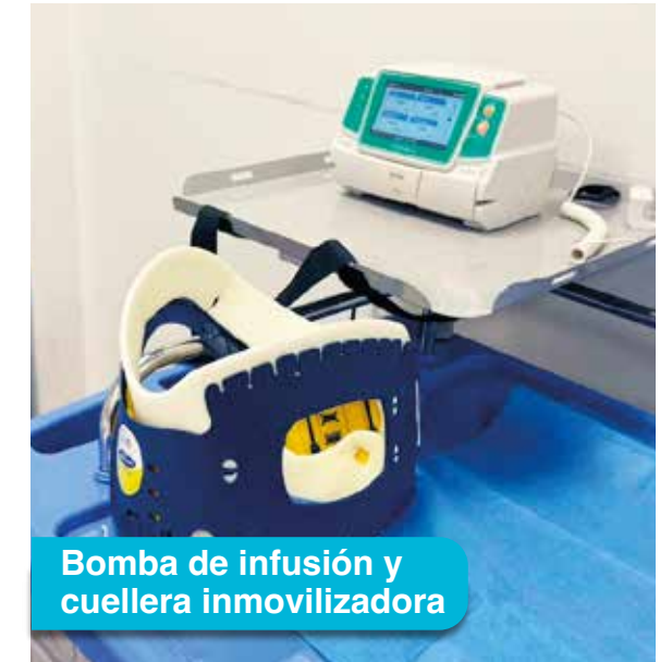
Bomba de infusión y cuello inmovilizadora