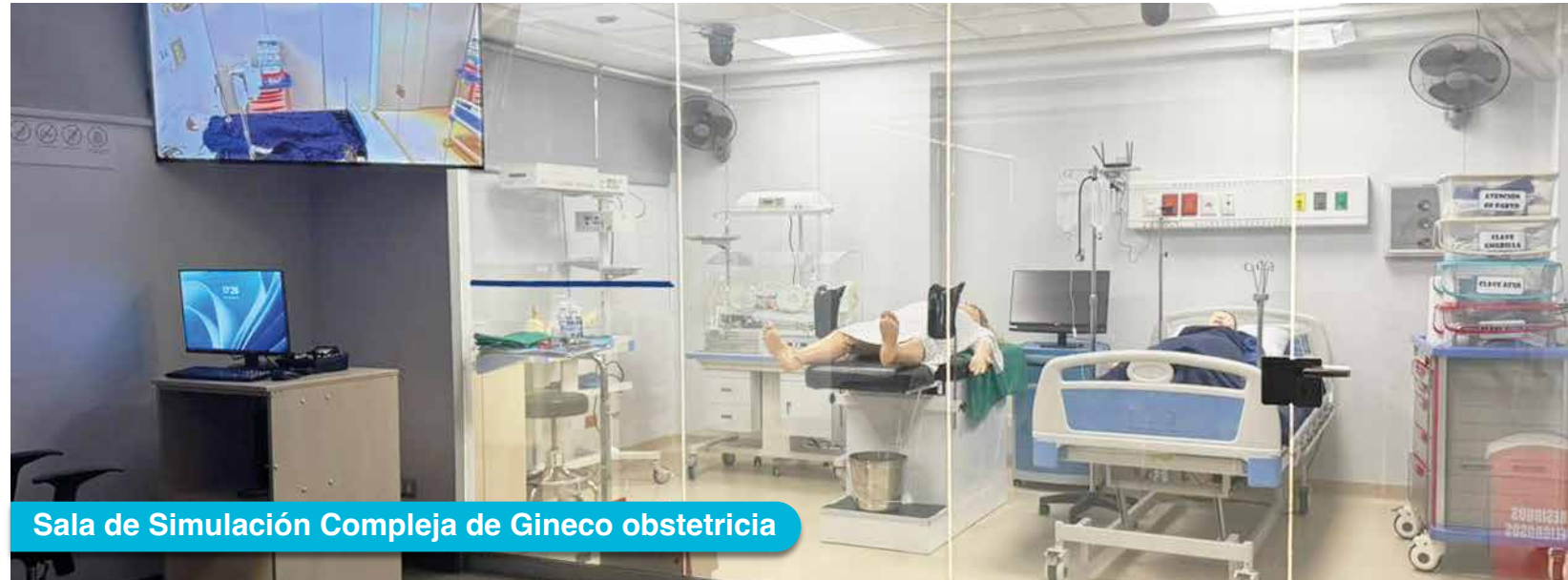
Sala de Simulación Compleja de Gineco obstetricia