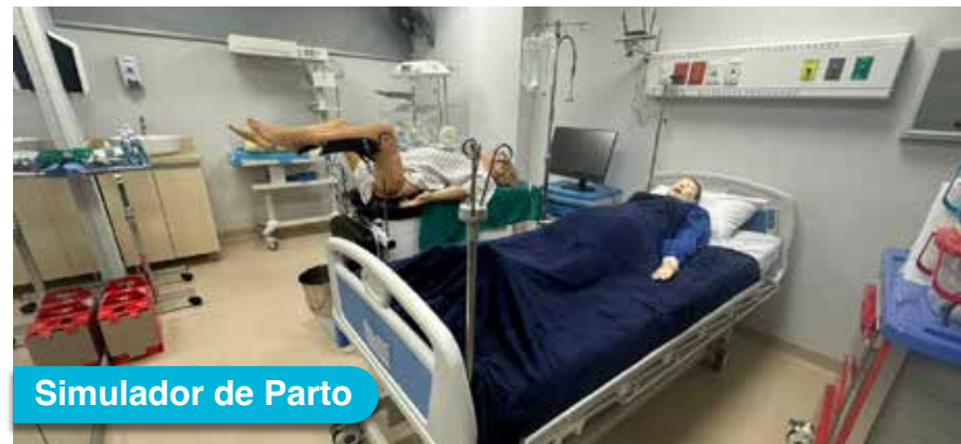
Simulador de Parto