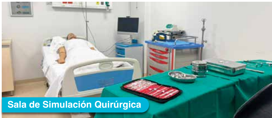
Sala de Simulación Quirúrgica