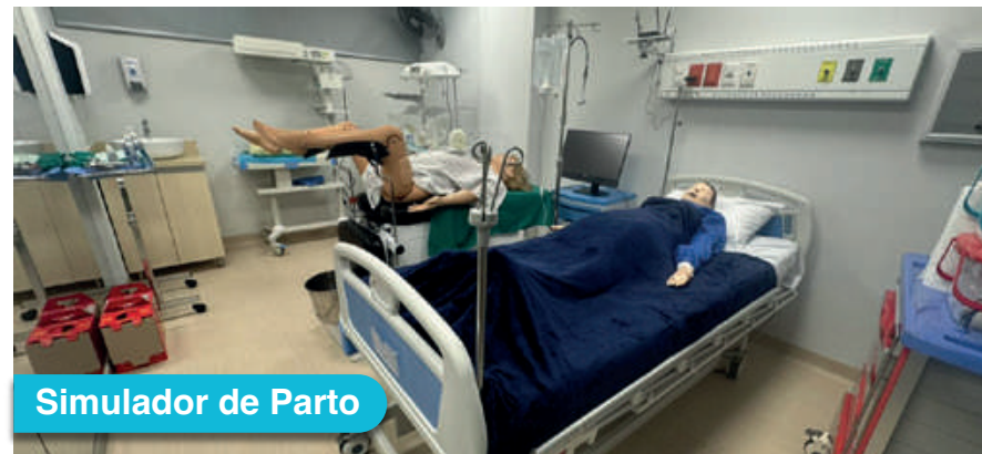
Simulador de Parto