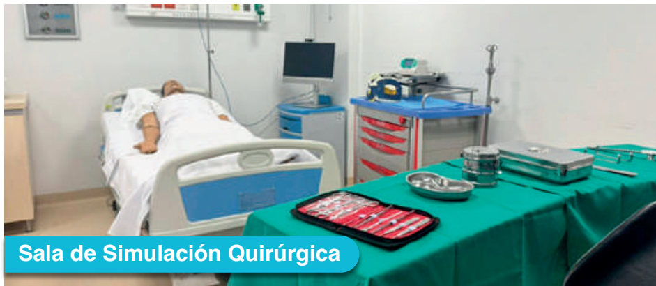
Sala de Simulación Quirúrgica