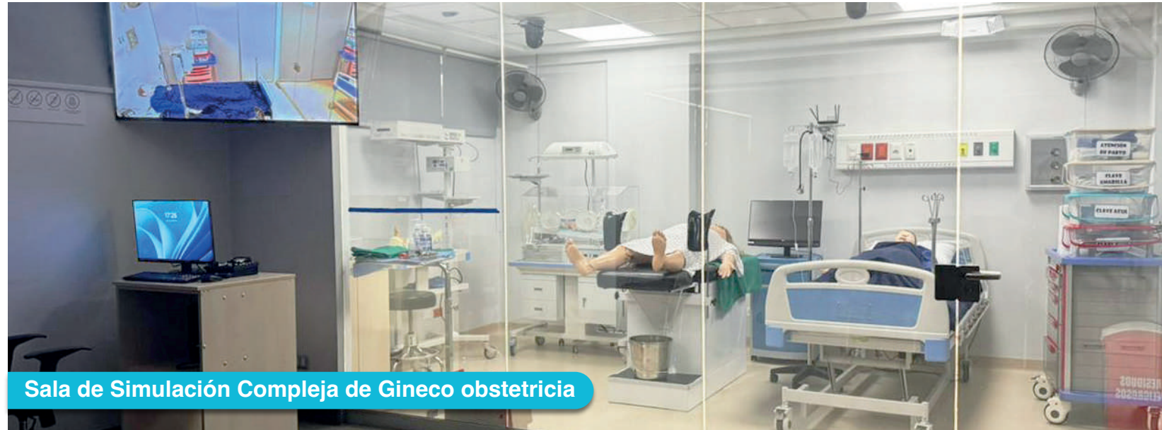
Sala de Simulación Compleja de Gineco obstetricia