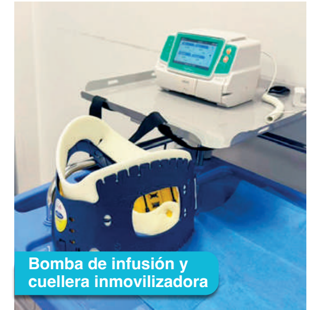
Bomba de infusión y cuellera inmovilizadora