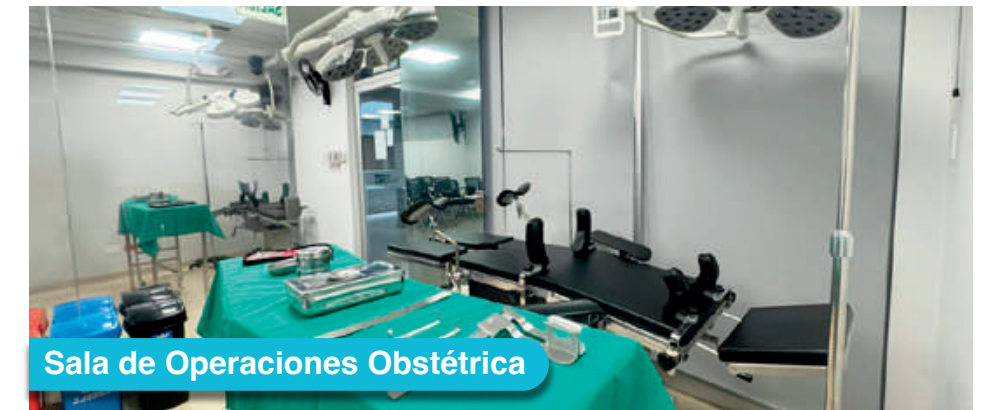
Sala de Operaciones Obstétrica

Utiliza nuestros laboratorios obstétricos especializados del más alto nivel. Desarrolla competencias técnicas, familiarizándote con equipamiento de simulación compleja. Prepárate para afrontar desafíos reales.