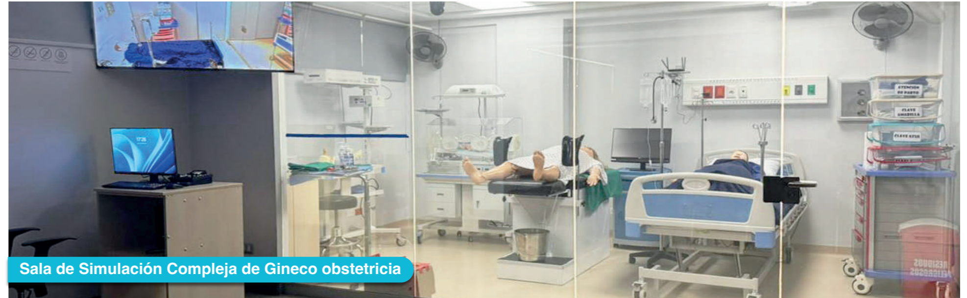
Sala de Simulación Compleja de Gineco obstetricia