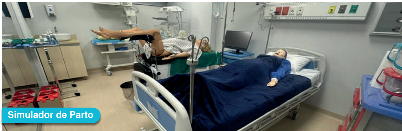
Simulador de Parto