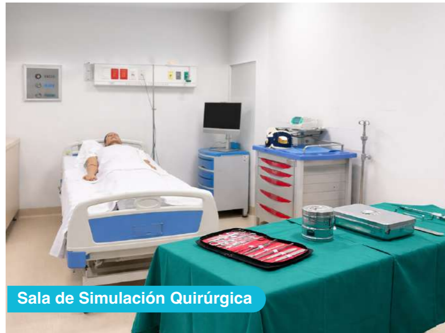
Sala de Simulación Quirúrgica