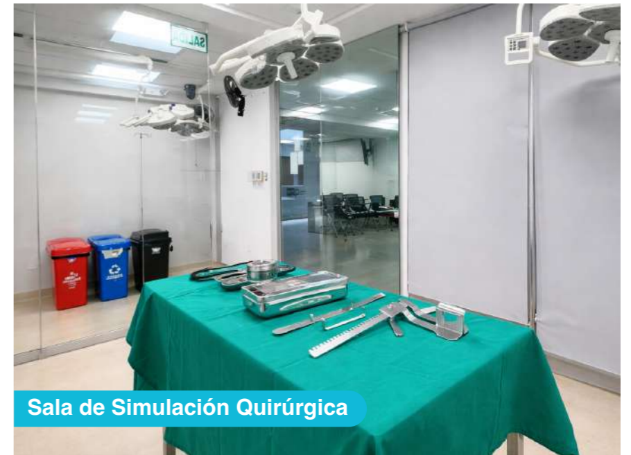
Sala de Simulación Quirúrgica

Utiliza nuestros laboratorios especializados del más alto nivel. Desarrolla competencias técnicas, familiarizándote con equipamiento de simulación compleja. Prepárate para afrontar desafíos reales.