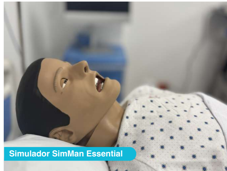
Simulador SimMan Essential