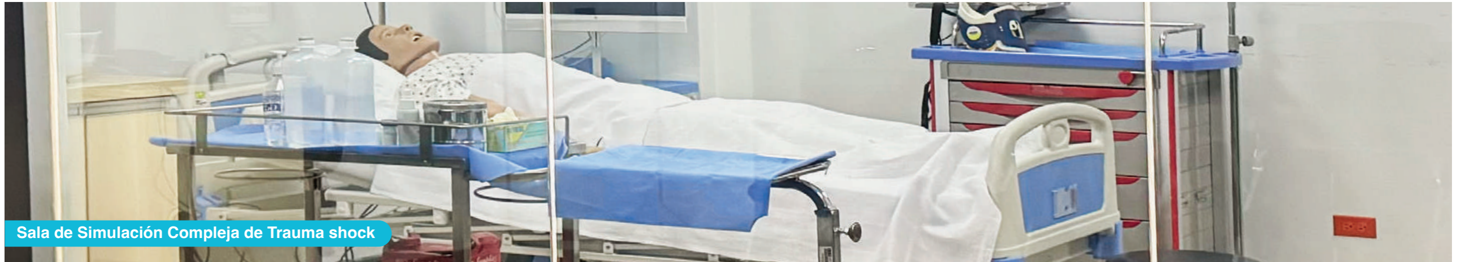
Sala de Simulación Compleja de Trauma shock