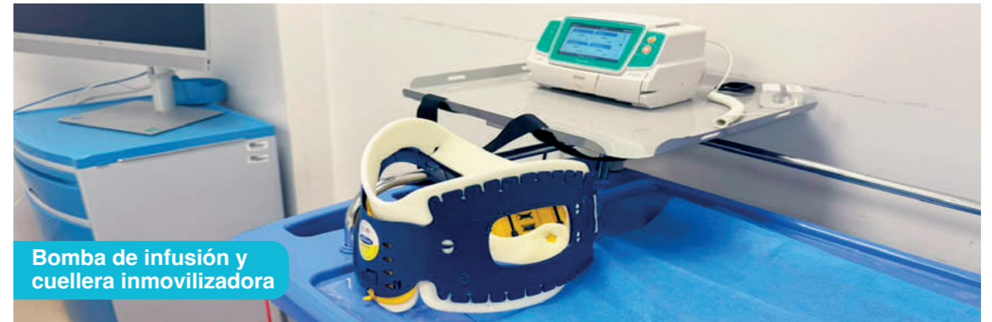
Bomba de infusión y cuellera inmovilizadora

Utiliza nuestros laboratorios especializados del más alto nivel. Desarrolla competencias técnicas, familiarizándote con equipamiento de simulación compleja. Prepárate para afrontar desafíos reales.